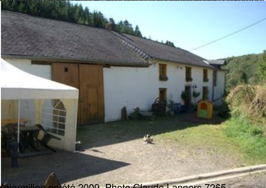
Kéiermillen en été, 2009 7265