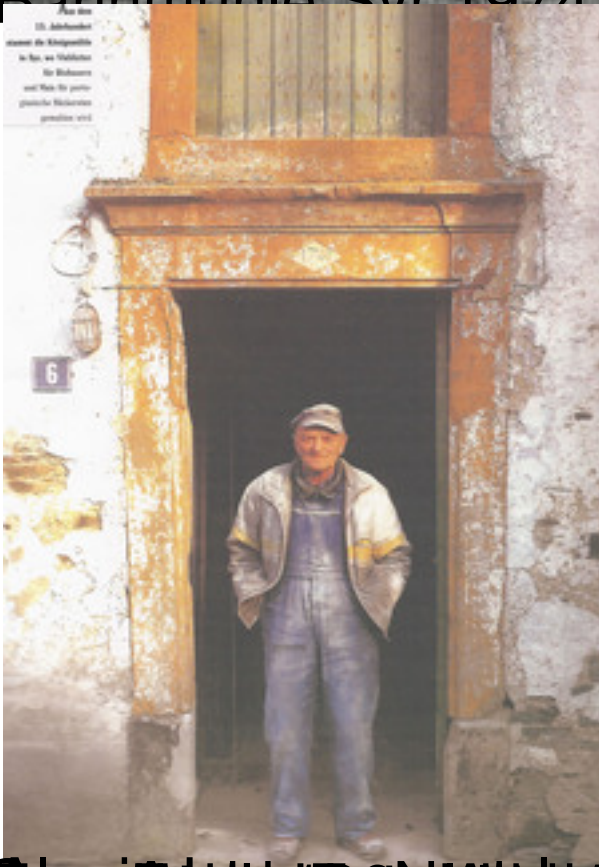
Charron et la Bannmühle vers 1974. http://www.chevaliers.com