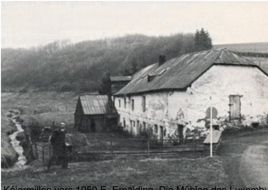
Kéiermillen vers 1950 E. Ernolding - Die Mühlen des Luxemburger Landes