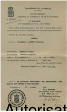
Autorisation d'établissement d'Eugène Lanners, 1938