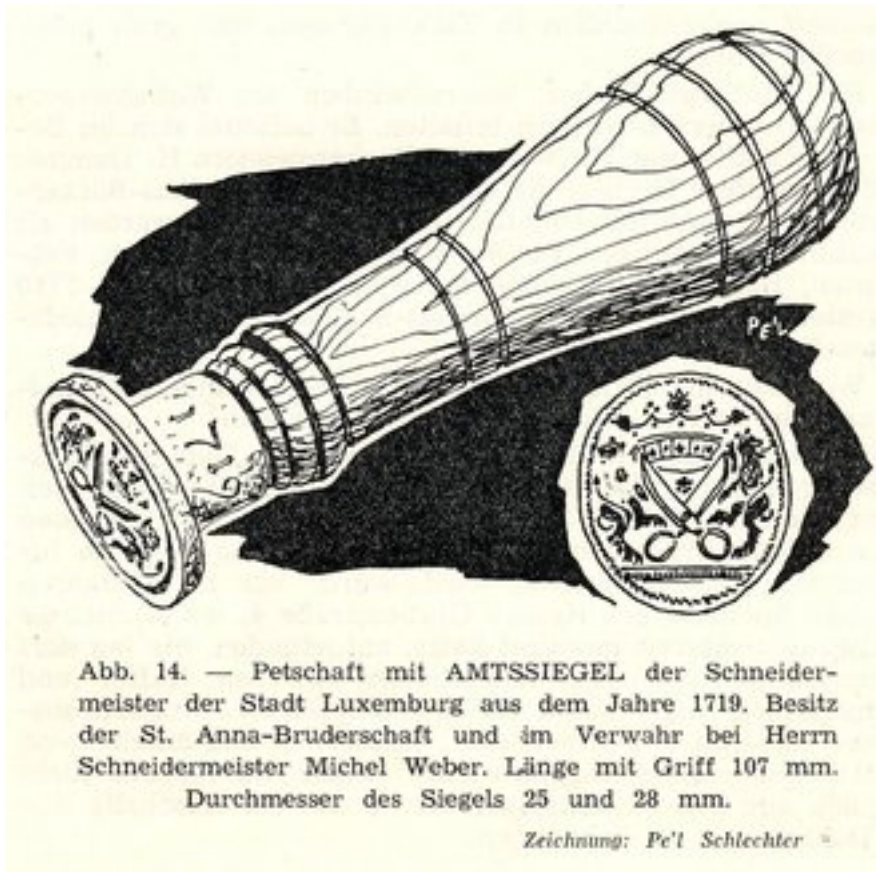
Abb. 14. — Petschaft mit AMTSSIEGEL der Schneidermeister der Stadt Luxemburg aus dem Jahre 1719. Besitz der St. Anna-Bruderschaft und im Verwahr bei Herrn Schneidermeister Michel Weber. Länge mit Griff 107 mm. Durchmesser des Siegels 25 und 28 mm.

Après la Deuxième Guerre Mondiale, les progrès du vêtement de confection en termes de qualité et le prix très bas résultant de la production de séries industrielles sonnèrent le glas du métier de tailleur, du moins dans nos régions. Il reste chez nous l'un ou l'autre tailleur qui travaille sur mesure pour une clientèle aisée. Dans d'autres parties du monde, notamment en Asie, la profession est toujours très vivante et sert une clientèle locale mais aussi internationale de touristes et d'hommes d'affaires.