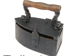
Fer à repasser chauffé au charbon