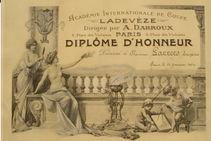
Diplôme d'Honneur de Coupe d'Eugène Lanners, Paris 1929