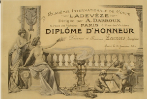
Diplôme d'Honneur de Coupe d'Eugène Lanners, Paris 1929