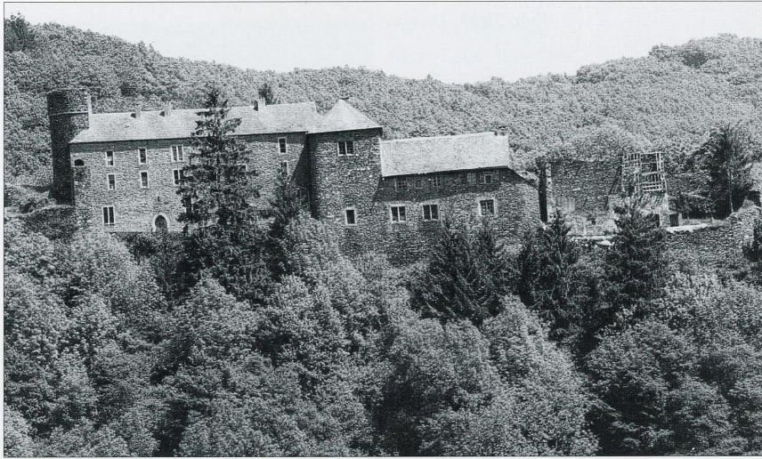
1990: Der Rittersaal, der Wohntrakt und das verfallene Ökonomiegebäude.

La Schuttbourg en 1973 BNL Biller aus der Gemeng Kautebaach, 2001)