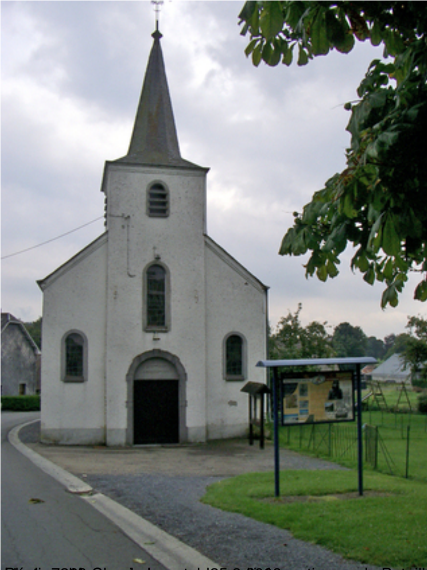
Église de Saint-Amand le 25.8.2009 Eglise de Saint-Amand le 25.8.2009

Thursday, 18 February 2010 20:13 - Last Updated Tuesday, 16 August 2011 19:58